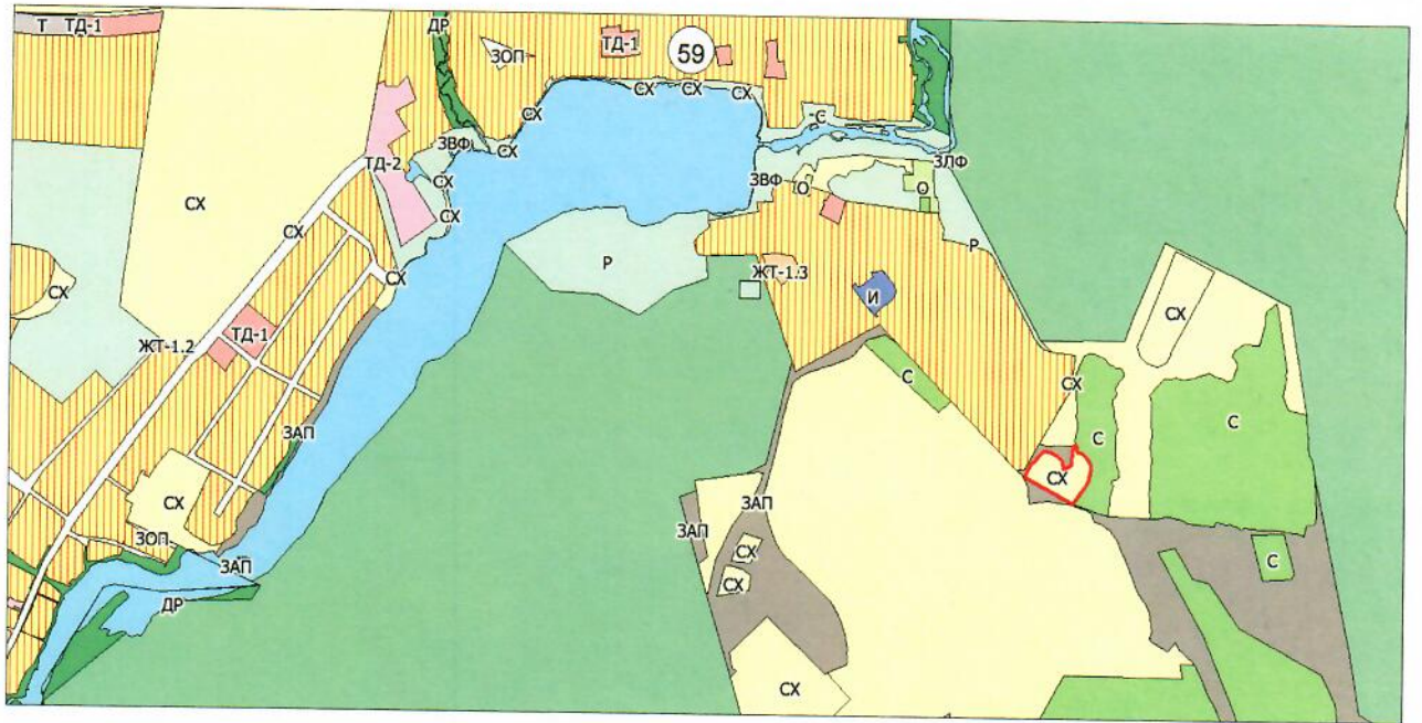
Фрагмент № 88